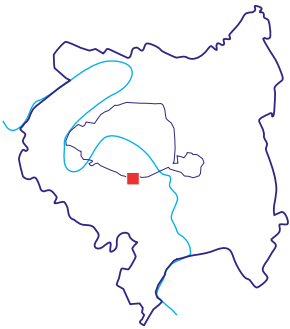
Site «Inventons la Métropole du Grand Paris», Un cœur pour le Plateau (rue de la Paix - rue de Reims)

Rue de la Paix, rue de Reims 94250 Gentilly